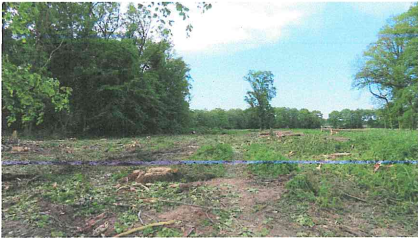
Holtestraße Aufn.: 15. 5. 2024